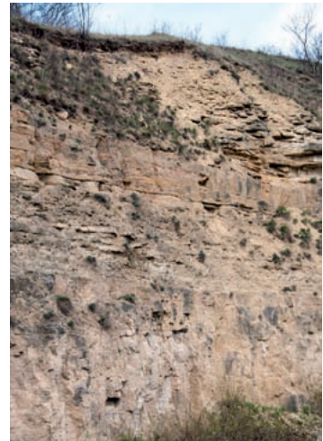
Schaumkalkbruch am Himmelreich bei Saaleck.