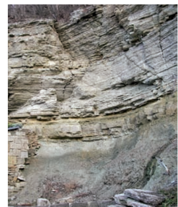
Geotop Röt-Muschelkalk-Grenze in Bad Kösen.

Die Gebäude des Klosters Schulpforta bestehen aus Schaumkalk. Im Fußboden treten durch lange Nutzung (Abrieb) harte Gesteinspartien plastisch hervor.